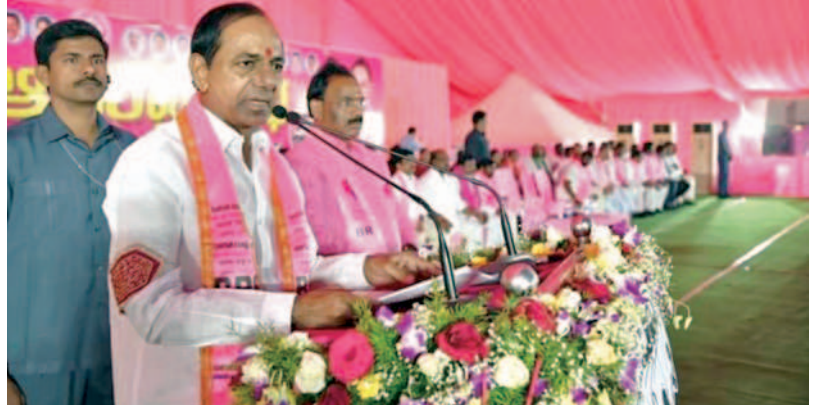
గురువారం నల్లగొండ జిల్లాలో మునుగోడు నిర్వహించిన ప్రజా ఆశీర్వాద సభలో మాట్లాడుతున్న ముఖ్య మంత్రి కెసిఆర్

మునుగోడు అక్టోబరు 26, ప్రభాతవార్త : మును గోడు రాజకీయ చైతన్యం ఉన్న ప్రాంతం. కర్నూలునల్ల జెండాలు ఎగిరిన ప్రాంతం. మొ కైతన్యం మూగదోవడు, పూజా పార్టీ మార్చే బేవర్లు మునుగోడును ఏపైనా చేస్తారు. ఎవరినైనా ముందుతారు. వాళ్లకు నియమం, నిర్దాంతం, నిబద్ధత లేదని నిన్న ఒక పార్టీ, మొన్న ఒక పార్టీ రేపు మతో పార్టీ అంటూ కేవలం డబ్బు, మద్యంతో ప్రజలను కొనగలుగుతామనే అహంకారంతో పార్టీ మారుతున్న ధన బేవర్ల నుండి మునుగోడును కాపాడాలని ప్రజాఆశీర్వాద సభలో ముఖ్యమంత్రి కె.చంద్రశేఖారావు ప్రజలకు పిలుపునిచ్చారు. ఈ సందర్భంగా ఆయన మాట్లాడుతూ ఆగమగంగా ఓట్లు వేయద్దని ఆలోచించి నిర్ణయం తీసుకోవాలన్నారు. గతంలో కాంగ్రెస్ పార్టీ 50, 60 సువర్ణం పొంది చిక్కల ప్రజలు నడుములు వంగిపోయి చచ్చిపోయేదాకా చూశారు తప్ప ఖైరేద్దీన్ నివారణ చేయలేదన్నారు.