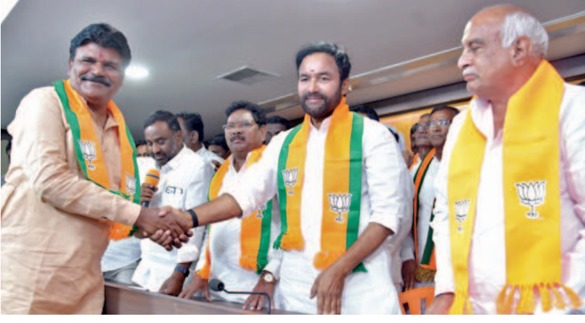
గురువారం బజిషి రాష్ట్ర కార్యాలయంలో రాష్ట్ర అధ్యక్షుడు కిషన్ రెడ్డి సమక్షంలో పార్టీలో చేరుతున్న నిర్దేశ జిల్లా ముఖ్యోద్యోగి నియోజకవర్గంలోని పలువురు జిల్లా పరిషత్ సభ్యులు, ఎంపీలను తదితరులు

టీకడంలో మంత్రి కెటిఆర్ హైదరాబాద్, అక్టోబరు 26, ప్రభాతవార్త: కాంగ్రెస్ పార్టీ అంటేనే రైతు విరోధి అని మరోసారి రుజువైందని మంత్రి కెటిఆర్ విమర్శించారు. ప్రజాక్షేత్రంలో ఆ పార్టీకి గుణపాఠం తప్ప దగ్గరలేదు. రైతుబంధువు సిలిపివేయాలని కేంద్ర ఎన్నికల సంఘానికి కాంగ్రెస్ పార్టీ ఫిర్యాదు చేయడంపై మంత్రి కెటిఆర్ స్పందించారు. ఇంటింటికి మంపిసిగ్గు 24గంటల కఠింబు కూడా ఆపేయమంటారా? అందులో కూడా కెసిఆర్ కనిపిస్తారు కదా అన్నారు. అన్నదాత పాలిటా నెంబర్ వన్ విలన్ కాంగ్రెస్ పార్టీ అని ఇతోసారి తేలిపోయిందన్నారు. పెట్టుబడి సాయాన్ని అడ్డుకునే కపట కుట్రను తెలంగాణ రైతులు సహించరన్నారు. అన్నదాతల పొట్టకట్టే కాంగ్రెస్ కుతంత్రాలను ఎట్టి పరిస్థితుల్లోనూ తెలంగాణ రైతులు భరించరన్నారు. రైతుబంధువును కాంగ్రెస్ లోబలు రాస్తున్న కాంగ్రెస్ తోకలు కట్టే చేయడం పక్కా ఇప్పటికే నమ్మి ఓటిసిన పాపానికి కర్ణాటక రైతులను అరిగిన పెడుతున్నారన్నారు. రైతుబంధువు పథకానికి కూడా పాతరేని ద్రోహం చేస్తున్న కాంగ్రెస్కు తెలంగాణ ప్రజాక్షేత్రంలో గుణపాఠం తప్పదన్నారు.